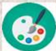
ILUSTRACIÓN MEDIOAMBIENTAL 15 de abril hasta el 15 de mayo